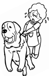
ペットの世話(犬の散歩など)