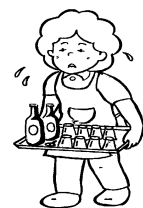
来客の応接(お茶、食事の手配など)