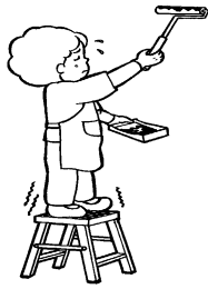
室内外家屋の修理、 ペンキ塗り