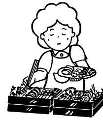
特別な手間をかけて行う 料理(おせち料理など)