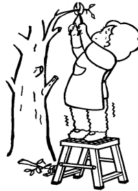
園芸(植木の剪定など)