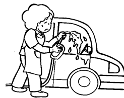
自家用車の洗車・清掃