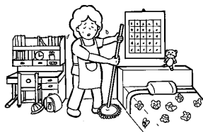
主として利用者が使用する居室等以外の掃除