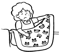
利用者本人以外の洗濯・調理・買い物・布団干し