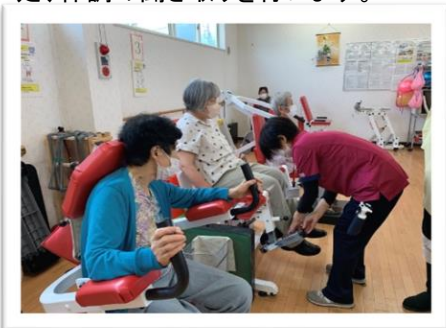
パワーリハビリトレーニングは、リハビリ専門職や看護職等の指導のもとに行います。