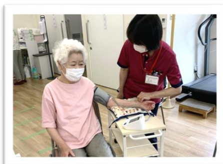
看護職員により、体温・血圧等の測定、体調の聞き取りを行います。

当事業所は、半日型リハビリデイサービスです。利用者の皆様を主体としたリハビリテーションとお仲間同士の楽しい会話にあふれた、くつろげる時間を提供しています。