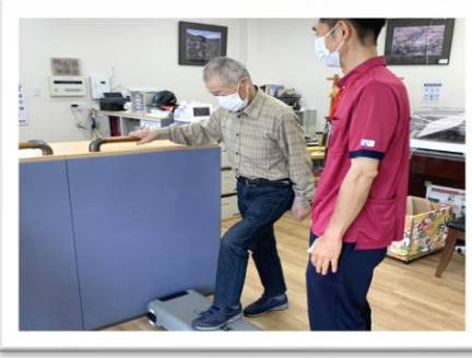
各自のリハビリ目標に合わせて、個別リハビリトレーニングも行います。