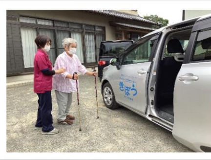
ご自宅まで送迎します。